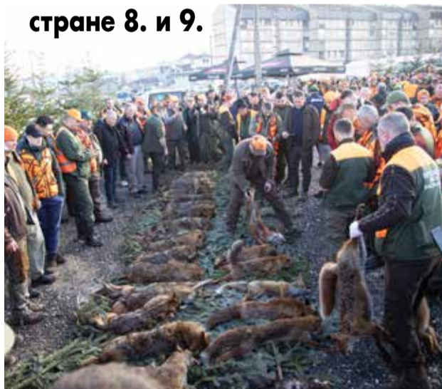
странице 8. и 9.

„ Шакалијада “ окупила 2.000 ловаца и љубитеља лова