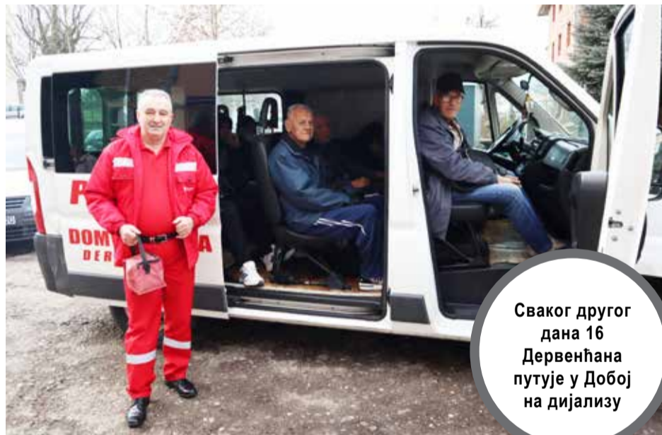
Сваког другог дана 16 Дервенћана путује у Добоју на дијализу

- Проблеми се, наравно, дешавају, недавно услед временских неприлика нисам ни могао отићи по пацијенте. Удаљена села, гдје иначе идем по њих, била су непроходна, али срећом људи су нам изашли у сусрет, довели су их. Исто тако, знало се десети да чекамо у колони до Добоја, јер немамо сигнализацију да иск-