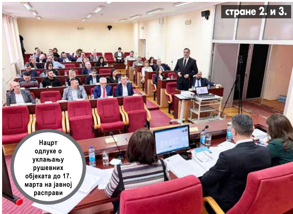
странице 2. и 3.

Скупштина града на првој овогодишњој сједници усвојила више важних одлука