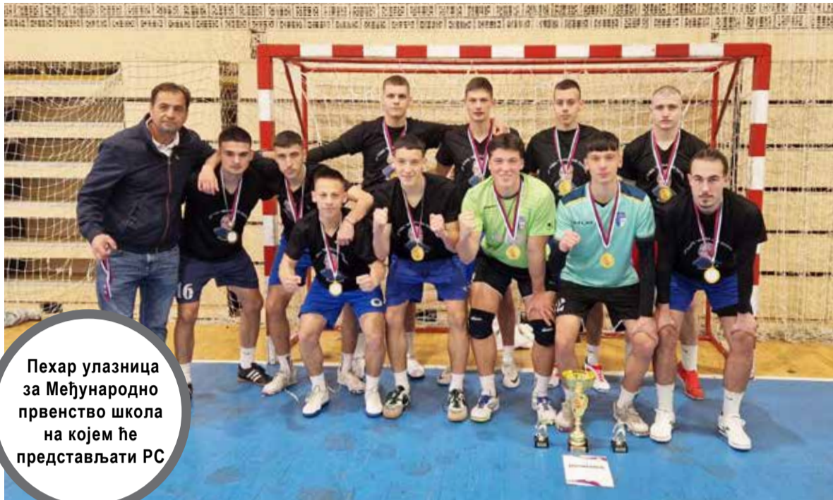
Пехар улазница за Међународно првенство школа на којем ће представљати РС

Да сваки сан може да постане јава, ако га његујете вриједним радом и посвећеношћу, доказали су ученици Средњошколског центра „Михајло Пупин“ који су своје фудбалске таленте и љубав према овом спорту крунисали титулом републичких шампиона.